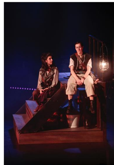
Ann Bonny et Mary Read, Compagnie Le chien qui tousse

On sait qu’elle a été en couple avec Calico. On trouve une date d’enterrement en 1733, en Angleterre. Mary Read est née en 1695. Elle se fait habiller comme un garçon très jeune et trouve un nom d’homme pour travailler sur un bateau : Willy Read. Elle rencontre Anne Bonny. Mary Read meurt en prison en 1721.